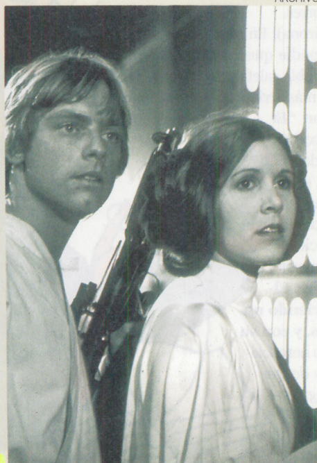
EL 25 DE MAYO STAR WARS CUMPLIRÁ 30 AÑOS.