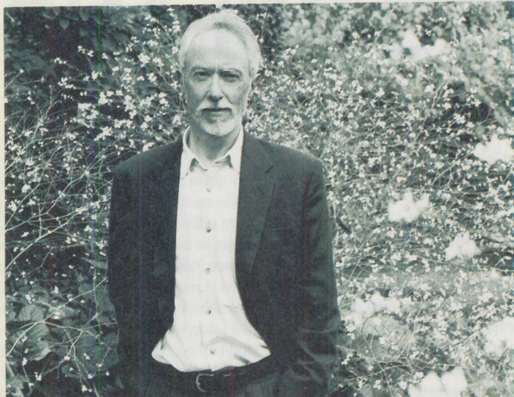
EL NUEVO LIBRO DEL NOBEL COETZEE LLEGARÁ A ESPAÑA ANTES DE NAVIDAD.